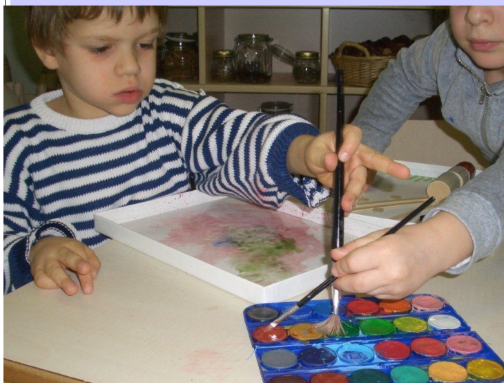
"Artisti insieme" - Foto per gentile concessione, riproduzione riservata

E' pertanto necessario prenotare la propria partecipazione con l'invito a comunicare tempestivamente l'eventuale impossibilità a partecipare, per dar modo ad altri di essere presenti.